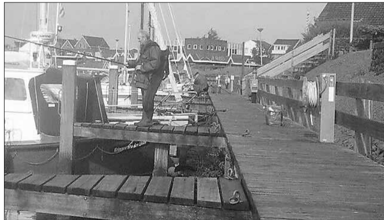
Goed toeven in Lemmer.

Het weer viel mee. De wind was gaan liggen en de regen bleef gelukkig uit. Zo rond tien liet zelfs de zon zich nog even gezien. Bij het kanaal