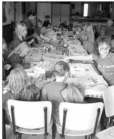
Lekker knutselen met elkaar.

Er kwamen vijftig kinderen en een tiental ouders deed mee. De opkomst was zo hoog dat er overhaast meer fruit gekocht moest